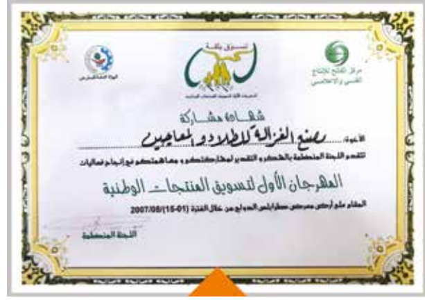
Honoring certificates to participate in international and local events